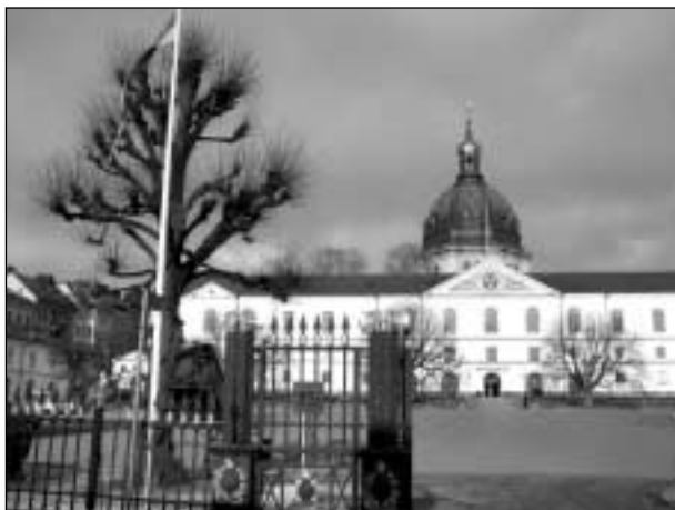
DET CENTRALA KANSLIET ÄR BELÄGET VID ARMÉMUSEUM I STOCKHOLM.

”Lottorna hade år 2003 19 628 medlemmar fördelade på 349 kårer och 24 förbund”