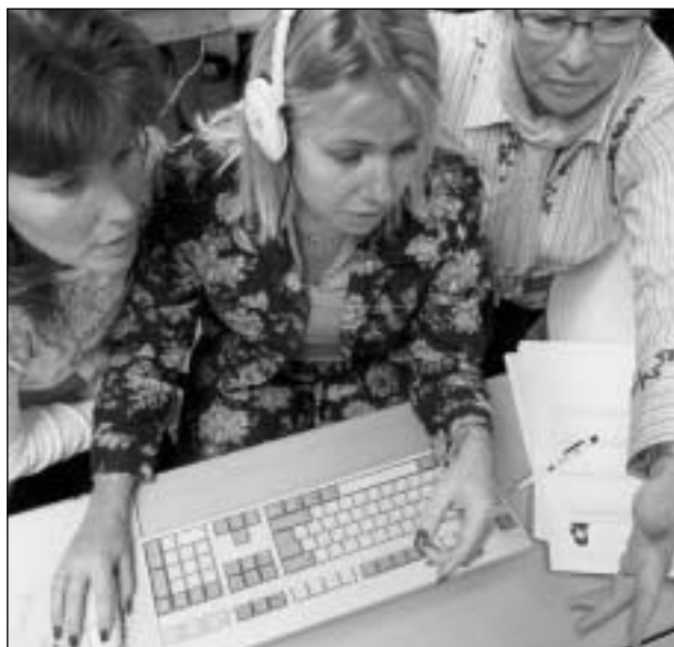
NÅGRA AV LOTTORNA SOM DELTOG I FÖRSTA KURSEN I "KOMMUNALT LEDNINGSTÖD".

2003 hade 14 lottaförbund tillsammans 221 kommunavtal. Vilka lottaförbund som har kommunavtal framgår av tabellen "Avtalsredovisning" (sid 22).